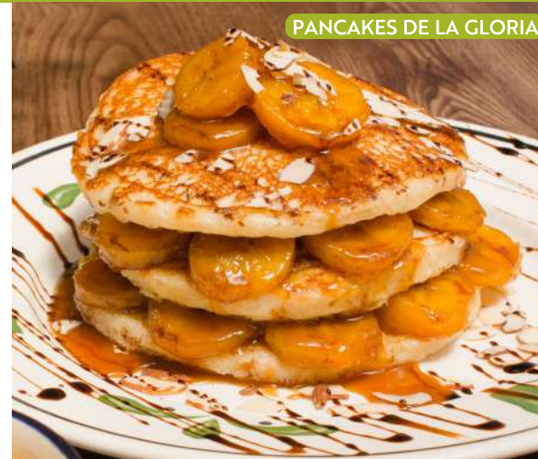
PANCAKES DE LA GLORIA

Servido con miel de abeja ó maple. $6.99