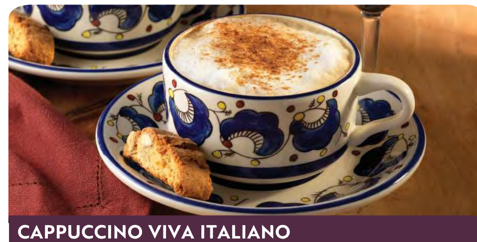
CAPPUCCINO VIVA ITALIANO

Cappuccino granizado y cubierto con crema batida y chispas de polvo cocoa $3.50