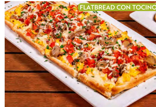
FLATBREAD CON TOCINO

Quesos Italianos y tomate toscano servido sobre una Flatbread y acompañada de frijoles. $7.99