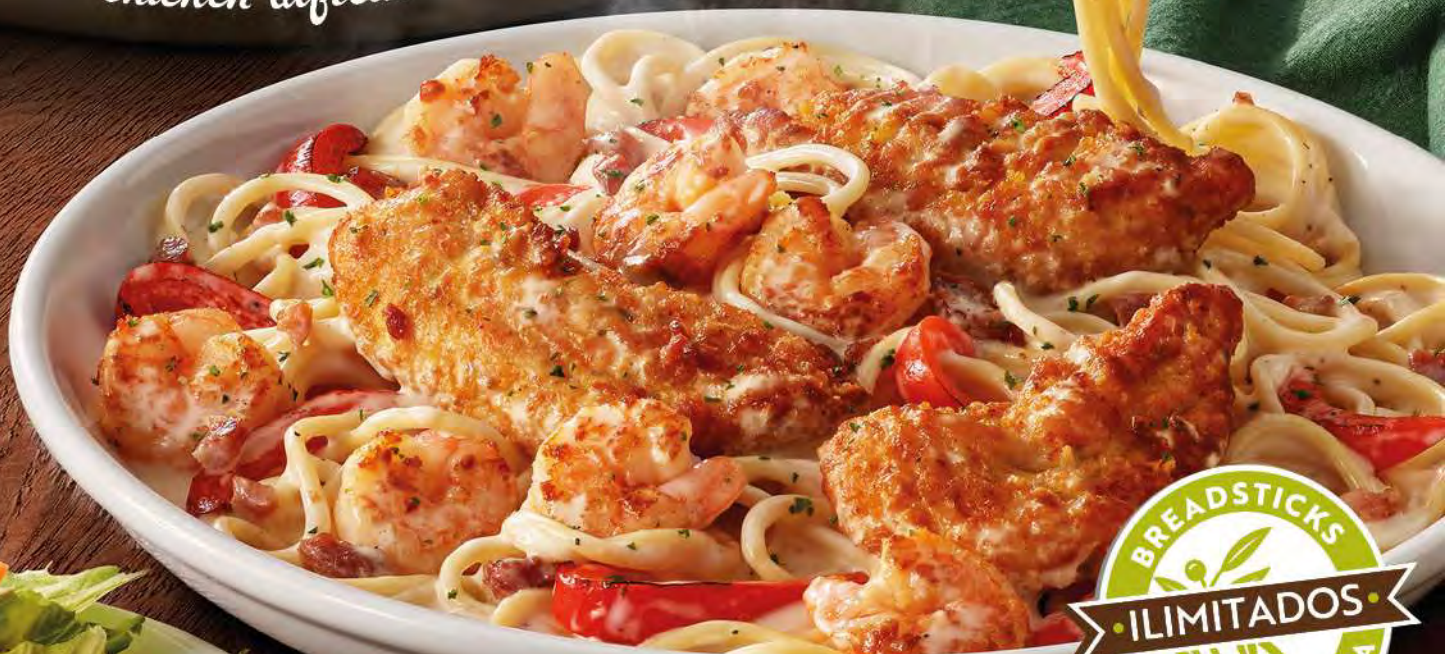
chicken & shrimp carbonara