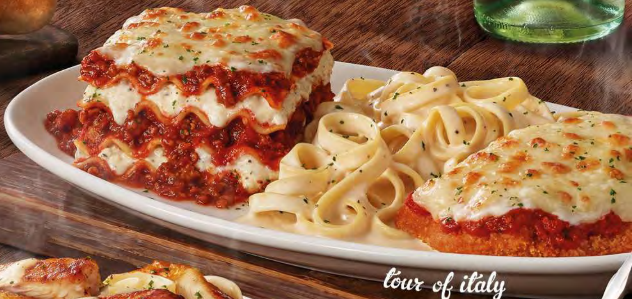
tour of italy