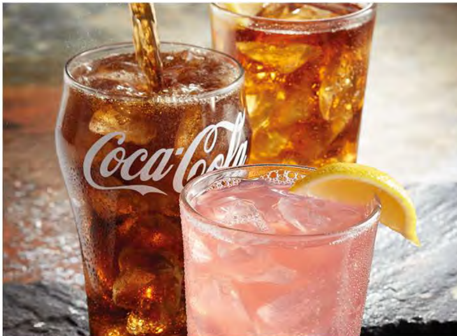
Imágenes con fines ilustrativos