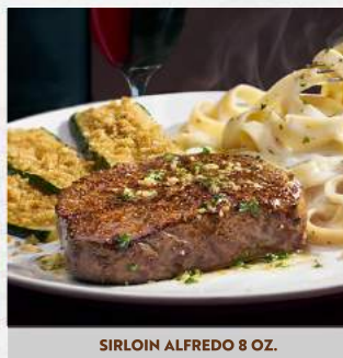
SIRLOIN ALFREDO 8 OZ.

*15 personas como mínimo por evento. Horario: Sábados y domingos de 8:00 a.m. a 11:00 a.m. Se servirán los platos en la hora estipulada. * Solicitamos un anticipo de $20.00 para confirmar la reserva. Debes escoger un plato. Precio incluye LVA. Los precios no incluyen propina (agregar 10%)