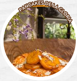
PANCAKES DE LA GLORIA